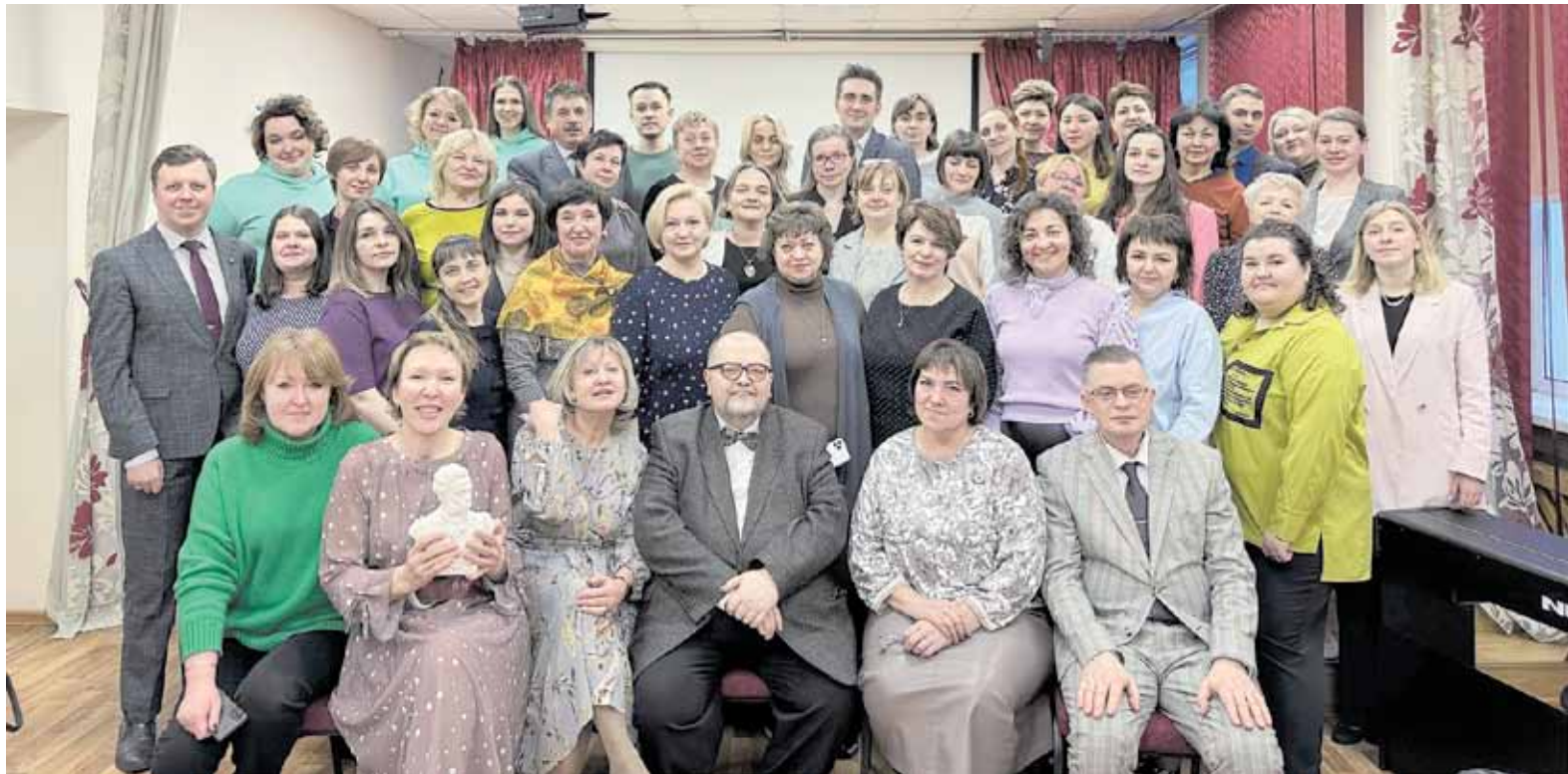
Участники и гости фестиваля: «Друзья, прекрасен наш союз!»

Да, именно в память об Александре Сергеевиче Пушкине 4 февраля вот уже шестой раз собрались учителя со всей страны на Педагогическую палатку «Пушкинский урок»-2023, которая проводится по инициативе Российского государственного педагогического университета имени А.И.Герцена при поддержке информационно-методических центров Красногвардейского и Центрального районов Санкт-Петербурга на базе