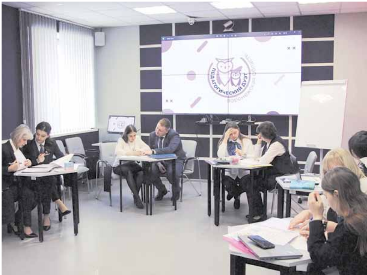
Тихо! Идет подготовка к выступлениям

- Моя помощь заключается в том, чтобы не подавлять, а дать возможность раскрыться молодому педагогу. У нас есть своя система, когда мы вместе планируем работу, вместе распределяем задачи между собой. И если молодому педагогу требуется помощь, я ее оказываю. А если справляется самостоятельно, я наблюдаю и сопровождаю. То есть следует не помогать постоянно, а давать возможность пробовать. Также мы проигрываем все моменты до того, как молодой педагог попадает к де-