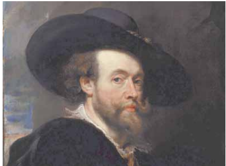
Питер Пауль РУБЕНС переосмыслил отношения живописи и дипломатии

Конечно, нельзя обойти вниманием и раздел «Миф о Вавилонской башне». Сколько ее метафорических воплощений видели в изобразительном искусстве, архитектуре, чертежах! Некоторые из этих воплощений