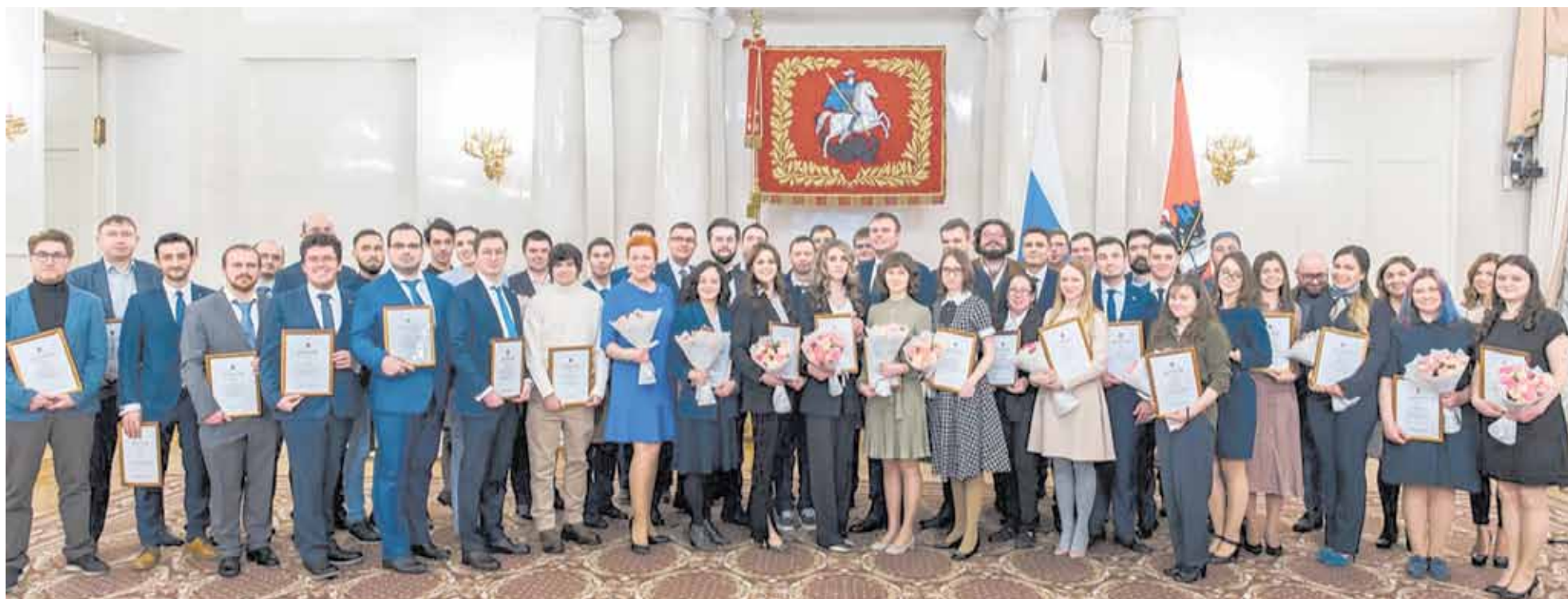
Лауреаты премии Правительства Москвы молодым ученым

С начала реализации проекта «Субботы московского школьника» в нем приняли участие свыше 1,4 миллиона человек. Участники проекта посещают ведущие научные организации, совместно с учеными и представителями вузов проводят практикумы и лабораторные эксперименты, обсуждают наиболее актуальные достижения и вопросы развития современной науки.