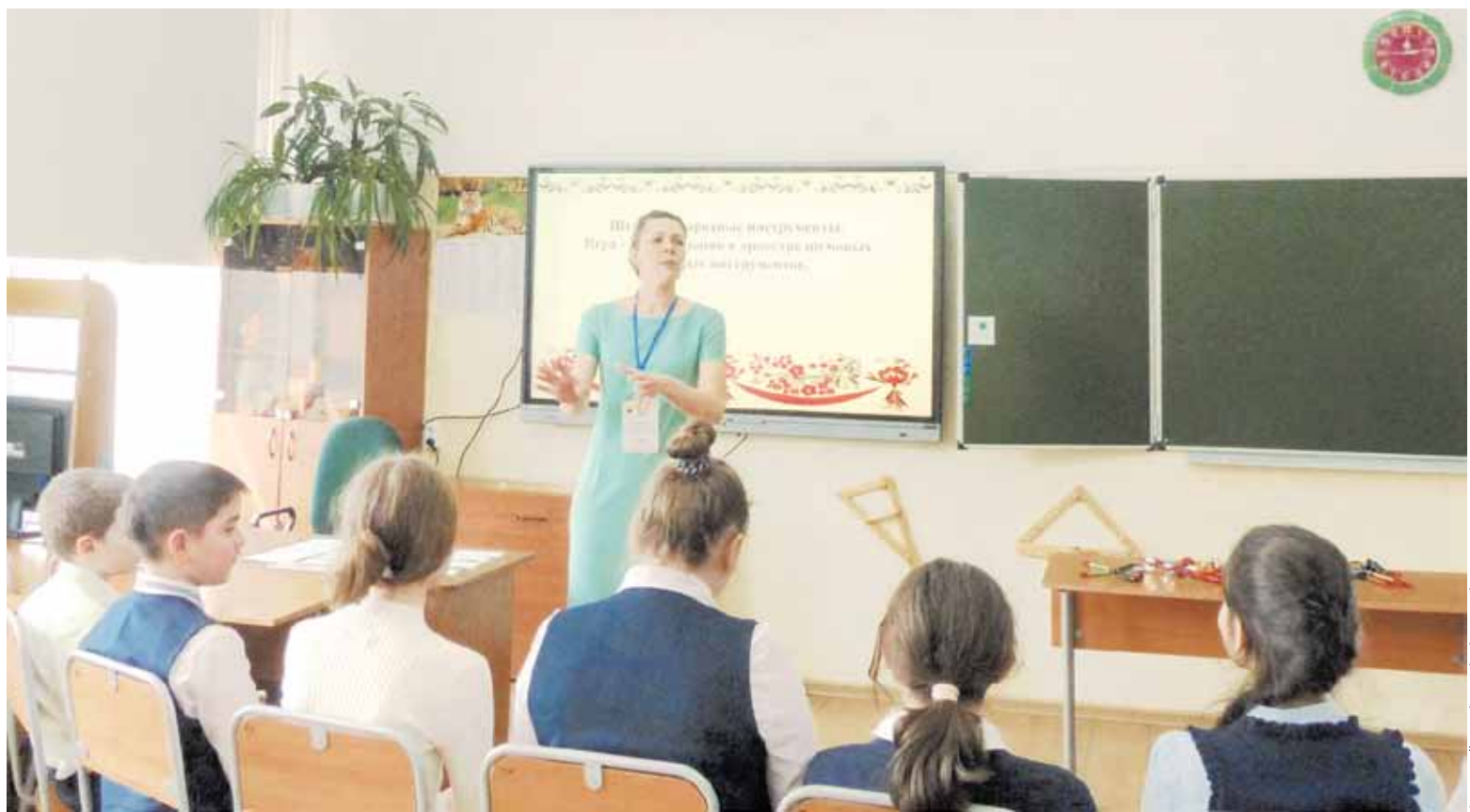
Ученики нисколько не сомневались в своем любимом педагоге

- Теперь я понимаю, как много значат участие в конкурсах, выход за привычные рамки, общение с коллегами, которым тоже много надо, кто стремится к совершенству в профессии. Я уже поучаствовала с тех пор во Всероссийской олимпиаде по русско-